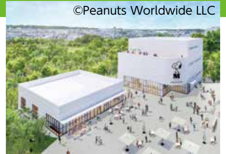
パークライフ・サイト(イメージ)

市と東京急行電鉄(株)が共同で進めている南町田拠点創出まちづくりプロジェクトで、南町田グランベリーパークが11月13日(水)にまちびらきを迎えることになりました。まちびらきに合わせて、鶴間公園と商業施設の全234店舗、公園と商業施設の間に位置する「パークライフ・サイト」内のまちライブラリー、南町田子どもクラブなどがオープンします。また、スヌーピーミュージアムは、12月14日(土)に開館することが決まりました。