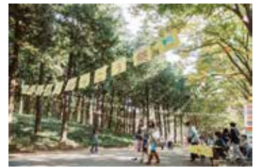
過去のがっこう祭の様子

新しい公園を楽しく活用するアイデアを一緒に実現し、盛り上げる出展者を募集します。まちのがっこう祭に出展したい、または運営に関わりたい、同パーク周辺で活動したい等の個人・団体の参加をお待ちしています。