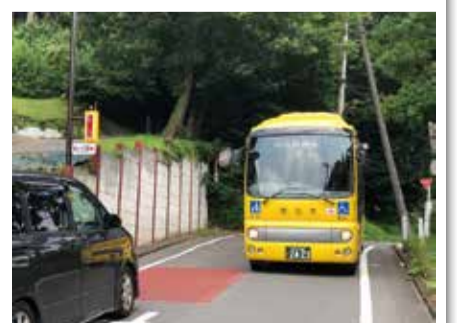
安全確保と輸送量を充実させた小山田桜台と多摩南部地域病院の間を走る小型バス

これからの超高齢化社会に向かって、市内の移動手段のうちバス交通はますます重要な役割を果たすこととなります。また、現状でも、交通が不便な地区もあります。現在「多摩都市モノレール」の延伸計画を進めていますが、その開通までには、まだ間があります。当面、地域における公共交通サービスについては、コミュニティバスを始めとするバスネットワークを充実させ、利便性の向上に努めていきたいと思っております。