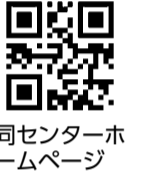
同センターホームページ