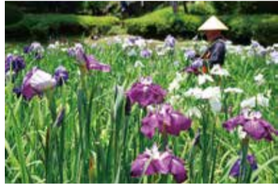
薬師池の花しょうぶ