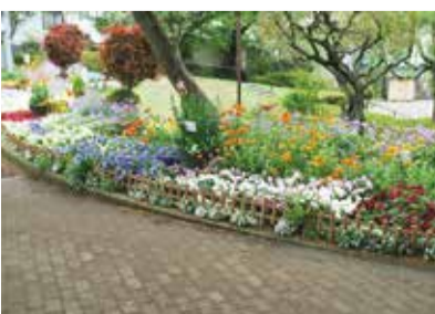
最優秀賞 忠生自然第3クラブの花壇

※受賞団体等コンクールの詳細は、町田市ホームページでご覧いただけます。なお、審査会は4月25日に実施したため、掲載写真と現在の開花状況は異なります。