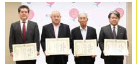
左から(株)三和住建、八王建設(株)、(株)若林工務店、(株)イワラ建設の皆さん

※表彰の基準=施工者の本店が市内にあり、契約金額1000万円以上、成績評価80点以上の工事