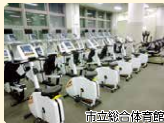
市立総合体育館 ランニングマシン全台にテレビモニターを装備

また、筋力トレーニングの機器もさまざまな種類があり、若者から高齢者までご利用いただけます。