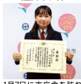
1月7日に市庁舎を訪れました

今号の広報紙は、12万4771部作成し、1部あたりの単価は12円となります(職員人件費を含みます。また作成経費に広告収入等の歳入を充当しています)。