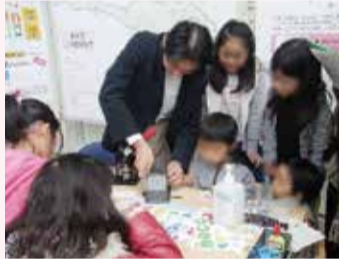
12月2日「まちカフェ!」の様子▶