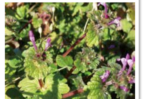
日だまりのホトケノザ

サッカーJ2リーグの町田ゼルビアの2019シーズンのゲームも始まります。フットサルのホームタウンチームペスカドーラ町田、2019-20シーズンの応援も引き続きお願いいたします。