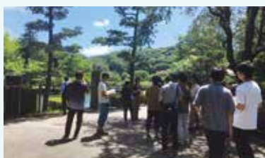
発表の事前準備に「町田薬師池公園 四季彩の杜」等を訪問