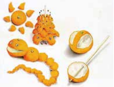
天木茂晴「ミカンの皮で作る」(水彩、紙)後期展示、個人蔵