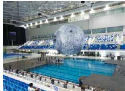
冬季五輪会場のプール

しっかり調べていないので、この指摘は当たっていないかもしれませんが、もって他山の石とすべき、というか、私たちの都市計画にも、反省すべき点があるのではないかと自戒をいたしました。