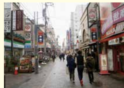
あなたの「お気に入りの看板」を見つけよう

申 9月20日正午～10月14日にイベントダイヤル(☎724・5656)またはイベシスコード 180920Cへ。