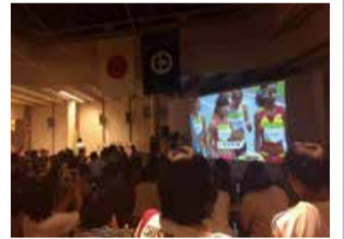
リオ大会パブリックビューイングの様子(2016年8月)