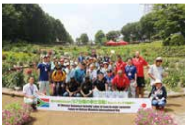
ダリア園での南アフリカ共和国交流イベント(7月)

ホストタウンとは、東京2020大会の参加国・地域を特定の自治体が応援し、交流を深めることを目的とした制度です。