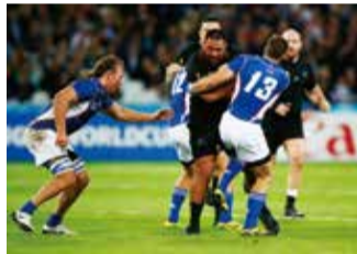
前大会(2015年)のナミビア代表(青)対ニュージーランド代表戦

市は、アフリカ地区代表の公認チームキャンプ地として、ナミビア代表「ウェルウィッチアス」のキャンプを受け入れます。