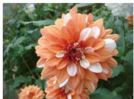
現在、ダリアの名前を募集中!

町田市としてこれからもさまざまな取り組みを続け、ラグビーワールドカップの機運を盛り上げていきたいと思っています。