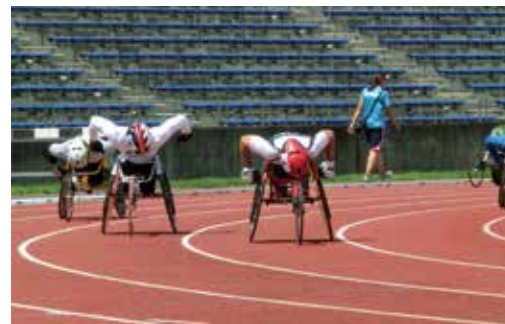
昨年の同大会の様子(車いす400mレース)

世界パラ陸上競技連盟認定の公式大会が町田で開催されます。過去には世界記録が生まれ、毎年日本記録が生まれているハイレベルな競技会です。