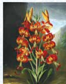
「フローラの神殿」より「カナダユリ」メゾチント 国際版画美術館蔵