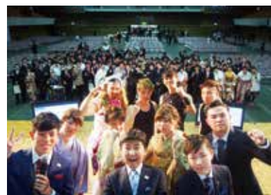
昨年の成人式の様子

場市立総合体育館 ※ステージには手話通訳と要約筆記がつきます。 ※公共交通機関をご利用下さい。