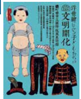
一人形衣しやう付 (部分) 公文教育研究会蔵

この展覧会では、明治の新風と江戸の面影のはざままで遊び、学ぶ子どもたちの姿を、当時の浮世絵を通して見つめます。