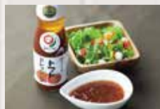
岡直三郎商店 「日本トマトドレッシング」