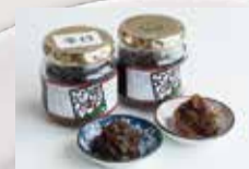
やさいの家 「からうまこうじ」