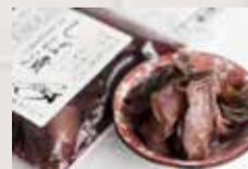
岡田屋 「町田しば漬」