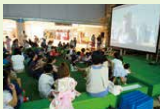
子どもも楽しめる「まちなかシネマ」