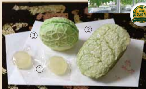
プレートはトライアル発注認定商品の「透き通る漆シート」(株)Duco