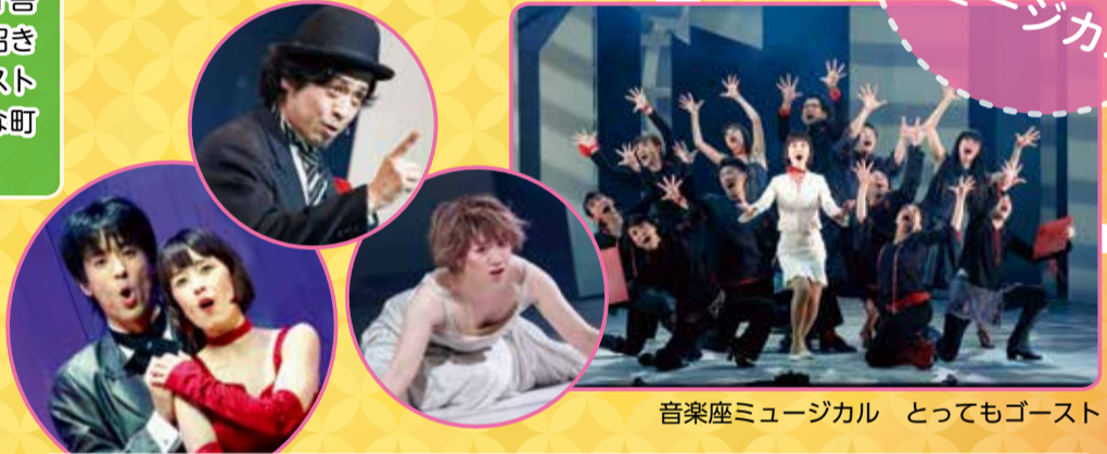
音楽座ミュージカル とってもゴースト