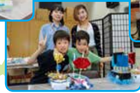
6月10日、11日に関連イベントとして行われたワークショップでは、玉川大学の学生が小学生に工作を教え文化芸術を通じて世代間の交流が生まれました。

開催中! 国際版画美術館 企画展 紙の上の いきものたち!! 会期:9月24日(日)まで 岡同館 ☎726・2771