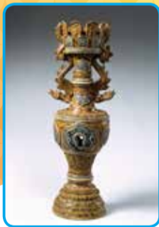
絹袖藍彩龍文燭台 (ベトナム16～17世紀)

開催中! 市立博物館 企画展 黄金の地と 南の海から 東南アジア陶磁の名品 会期:9月3日(日)まで 岡同館 ☎726・1531