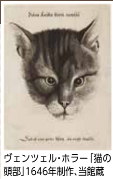
ヴェンツェル・ホラー「猫の頭部」1646年制作、当館蔵