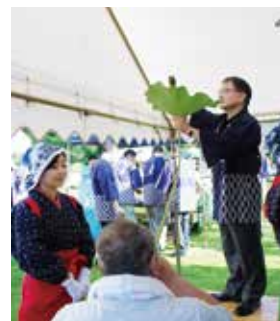
昨年の観蓮会の様子

○交通 小田急線町田駅北口POPビル先21番バス乗り場から本町田経由野津田車庫行き、または本町田経由鶴川駅行きバスで「薬師池」か「薬師ヶ丘」下車 ※薬師池公園駐車場は、当日有料です。混雑が予想されますので、公共交通機関をご利用下さい。