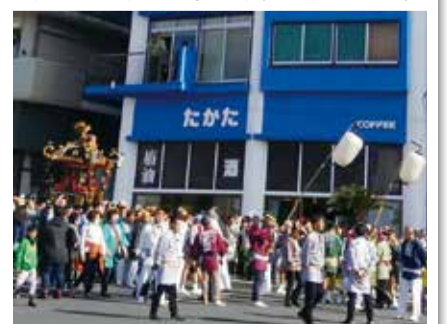
伊豆大島椿まつりににぎわい

岡田港の周辺で見聞きた、主な野鳥は次のとおりです。セグロカモメ、オオセグロカモメ、イソヒヨドリ、ウミウ、ヒヨドリ、トビ、ミサゴ。