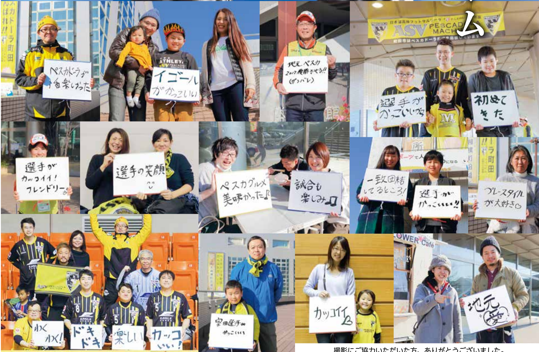
撮影にご協力いただいた方、ありがとうございました。