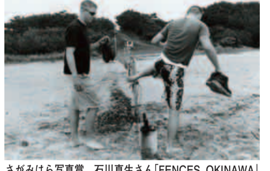
さがみはら写真賞 石川真生さん「FENCES, OKINAWA」

優れた写真作品を鑑賞することや、写真を通じたイベントに参加することで、写真の魅力を総合的に楽しめます。