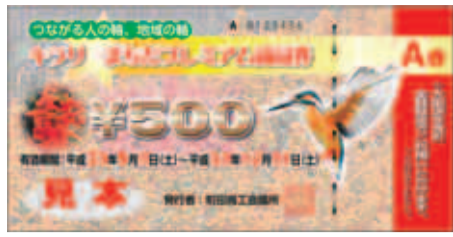
全登録店で利用できるA券

町田商工会議所では、1万円で購入し1万1000円分の買い物・サービス等が受けられる、とってもお得な「キラリ☆まちだプレミアム商品券」を下表の場所で引き続き