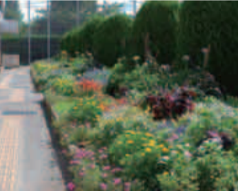
優秀賞「小山田中学校」の花壇

お問い合わせください。 町田商工会議所 町田公園緑地課 ☎793・7617 12 FAX793・7617