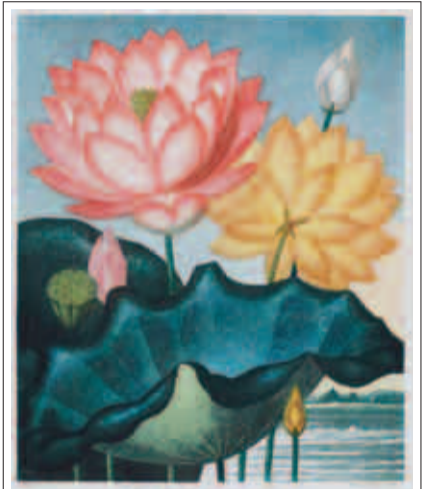
R・J・ソントントン『フロラの神殿』より「エジプトハス」 1804年 銅版 町田市立国際版画美術館蔵