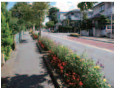
優秀賞「鶴川第二小学校PTA」の花壇

2団体の中から、最優秀賞に「森野三丁目自治会」、優秀賞に「鶴川第二小学校PTA」、「南町田病院を花でいっぱいにする会」、「小山田中学校」の3団体選ばれました。 また、優良賞に17団体、努