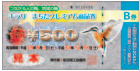
大型店以外の登録店で利用できるB券

町田商工会議所では、1万円で購入し1万1000円分の買い物・サービス等が受けられる、とってもお得な「キラリ☆まちだプレミアム商品券」を下表の場所で引き続き