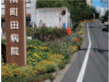
優秀賞「南町田病院を花でいっぱいにする会」の花壇

力賞に29団体が選ばれました。受賞団体などコンクールの詳細は、町田市ホームページ