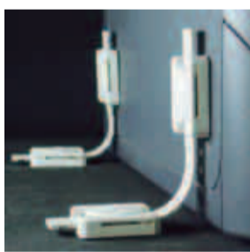
パソコン等を固定します

(三輪緑山1-1)で、町田市、町田消防署、町田市消防団などの各機関から合計約250人が参加し、町田市総合水防訓練を実施します。この訓練は、台風や集中豪雨が予想される雨期を前にして、大雨による浸水等の被害を想定し、水防態勢の万全を期するために実施するものです。都市型水害の対応工法を始