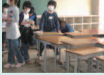
5月12日には、七国山小学校・山崎中学校の皆さんが、長瀬小学校へ贈る机や椅子をきれいにしました。