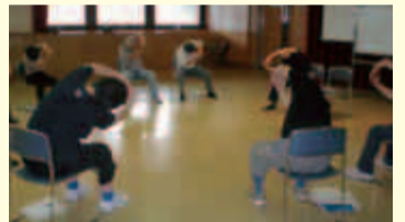
食事・運動セミナー

食事・運動セミナーも あります。 皆さんで取り組み状況 を報告し合いながら実 技を体験しましょう。