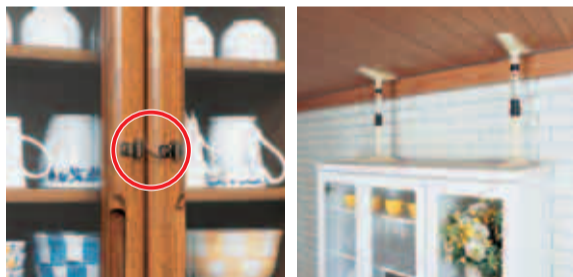
食器等の飛び出しを防ぎます 天井との間に設置します

が一つになる」に基づき、「町田市立陸上競技場整備基本計画」を策定しました。 Jリーグの試合開催が可能な競技場、日本陸上競技連盟公認陸上競技場、そして大規模スポーツイベントの開催にも対応した公園施設として、整備を進めていきます。