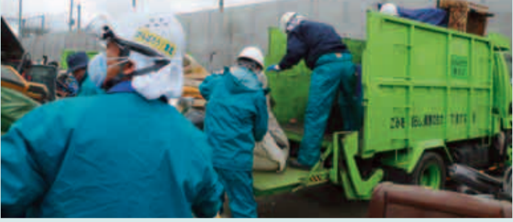
4月18日～22日に、ダンプ車で家具などのごみ処理を行いました。