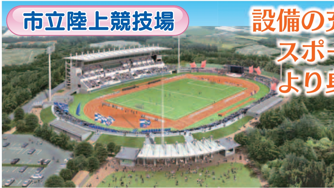
整備後のイメージ図