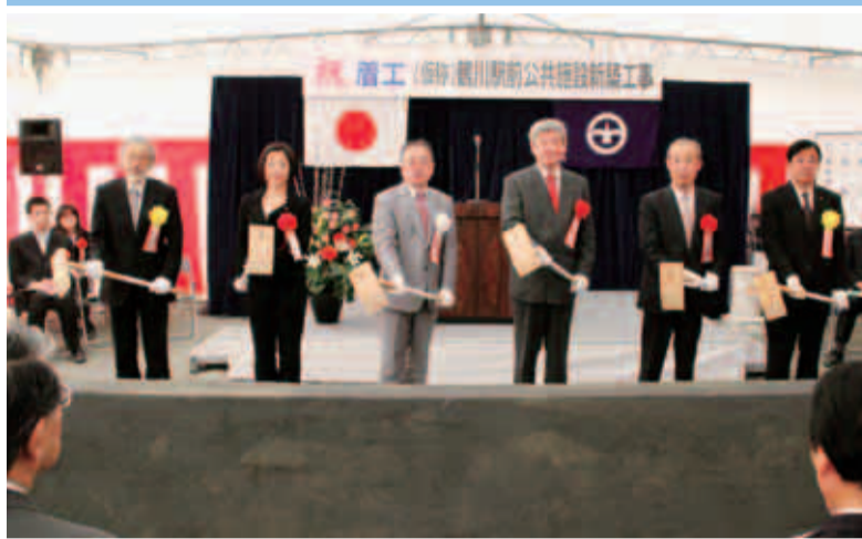
くわ入れ式 左から設計者、くしぶち衆議院議員、石阪市長、川畑市議会議員長、中里町内会・自治会連合会長、施工者