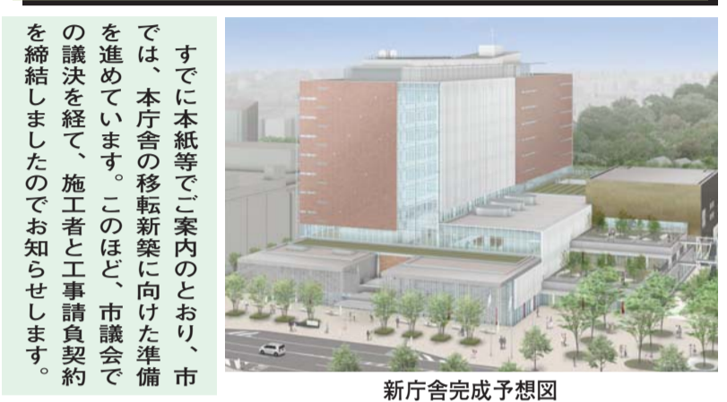
新庁舎完成予想図

すでに本紙等でご案内のとおり、市では、本庁舎の移転新築に向けた準備を進めています。このほど、市議会での議決を経て、施工者と工事請負契約を締結しましたのでお知らせします。