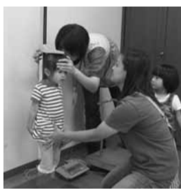
にぎやかな雰囲気の中でフリートーク(写真上)＝大きくなったかな?身長測定

しかし、この地域には子どもに関する施設が少なく、この地域に乳幼児を持つ保護者同士が集う場所がありません。そこで、地元の鶴間町内会、民生・児童委員、こどもセンターばあなどが協力して母親同士の交流、友達作りを目的として、子育ての悩みやよるこびを分かち合う場が、鶴間町内会館を会場に設けられました。