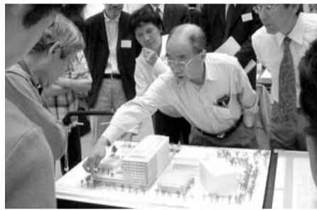
熱のこもった検討