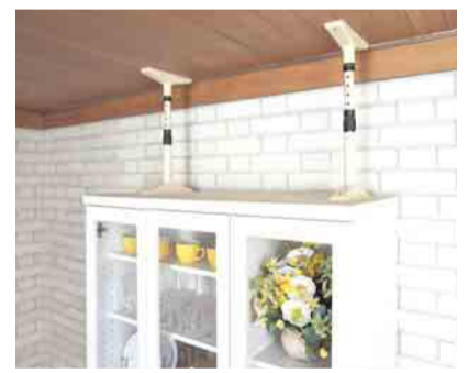
突っ張り棒のほか耐震シート、粘着耐震ゴムなどがあります

地震が発生したとき、建物が倒壊しなくても、室内の家具類の転倒等により被害を受けてしまうことがあります。 市では、震災時の家具類転倒等による被害の減少を目的に、市内に居住する世帯に対して、家具の転倒防止器具等を支給します。 また65歳以上の方のみの世帯や障がいをお持ちの方のいる世帯等に対しては、器具等の取り付けも行います。