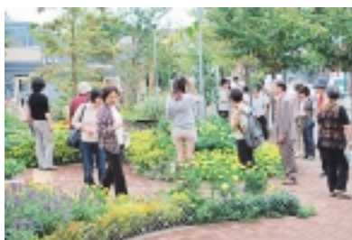
皆さんと一緒に「花まちツアー in まちだ」

町田市ホームページで連載中の市長メッセージ「カワセミ通信」を今回から広報に掲載します。町田市の市政や自然、歴史、文化などについての市長の感想、体験、意見などを随筆風に綴っているもので、市民の皆さんが気軽に読むことができる内容です。 「カワセミ」を愛読下さい。