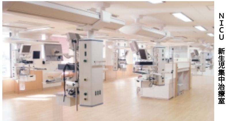
NICU 新生児集中治療室

充実した診療体制 新生児においては最新の設備を備えたNICU(新生児集中治療室)6床が新設され6人の新生児専門医師が、また母体・胎児管理においては7人の産婦人科医師が、いずれも24時間365日対応します。 問 市民病院医事課 ☎722・2230