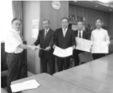
市から感謝状を贈りました

日時 11月2日(日)午後2時～4時(1時30分開場) 講師 早稲田大学名誉教授