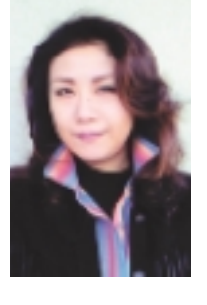
町田市民ホール開館30周年記念 (財)町田市文化・国際交流財団