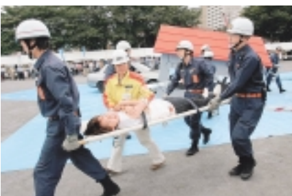
消防団とボランティアも協力