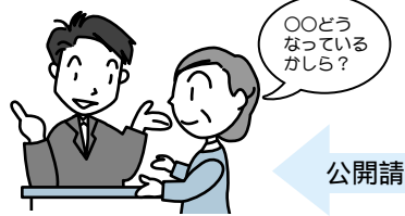
「市政情報やまびこ」