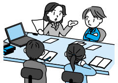
情報公開・個人情報保護審査会