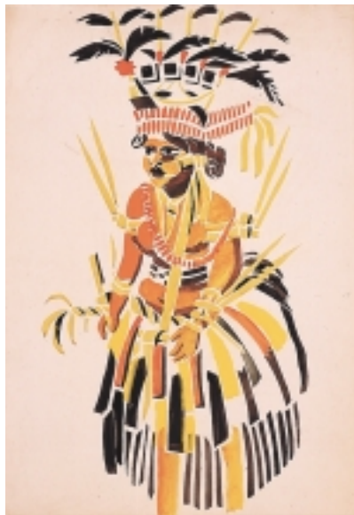
染木 照 ヤップ島女人の舞踊装(ガチャパルのモロイ) 1939年 ステンシル 55.1 x 39.4 cm