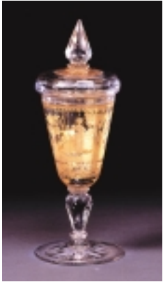
ゴールドサンドウィッチ 狩猟文蓋付ゴブレット チェコ 18世紀

市立博物館所蔵のガラス作品のなかから今回はボヘミアガラスおよび中国ガラスの代表作150点を展示します。