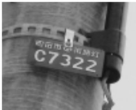
街路灯番号がわからない場合には、お近くの地番をお知らせ下さい。

町田市コールセンター ☎724・2105 カメラ機能付の携帯電話では、左の携帯版QRコードを利用して町田市ホームページ