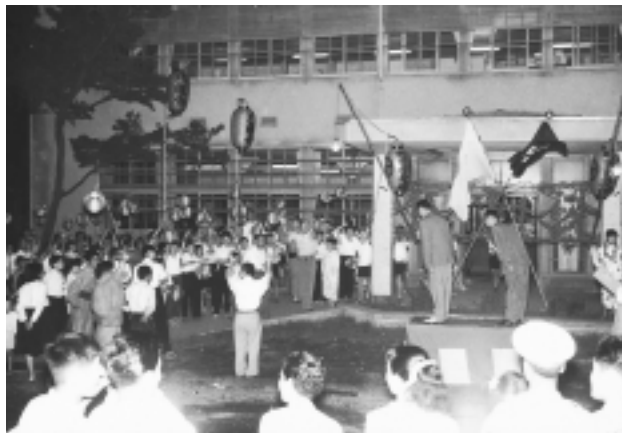
昭和33年、多数の市民が提灯などを手に旧市役所前で市制施行を祝いました。

町田市は1958年(昭和33年)2月1日に1町3村の町村合併により人口6万人余りの市として誕生しました。以来、商業を中心として多摩丘陵の恵まれた自然や伝統、文化遺産などを背景に多くの市民の力によって発展し、今では人口41万人を超え