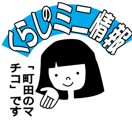
消費生活センターから

2000年4月に公的介護保険制度がスタートし現在に至っています。今まで介護は「妻や嫁がするもの、可能でない者には行政が措置するもの」と考えられていたが、これを「社会全体で支えるもの」と従来の考え方を大改革させ、「老後をできるかぎり在宅で暮らし続ける」事を可能にし、「介護サービスを利用者(消費者)自身が主体的に選択する」画期的な制度です。