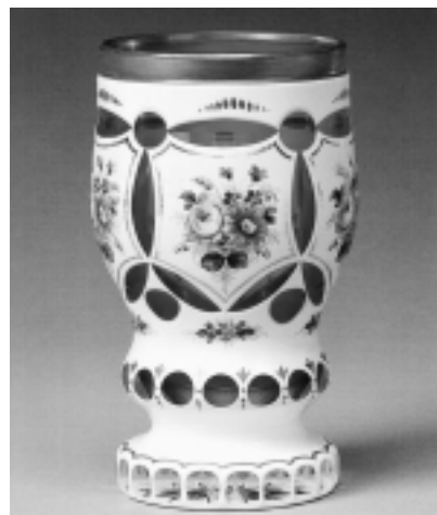
エナメル花文杯(ボヘミア=チェコ)

市立博物館のガラスコレクションは、ボヘミア(チェコ)と中国清朝の二大コレクションを中心に、ヨーロッパ各国のガラス、地中海沿岸出土の古代ガラス、江戸から現代にかけての日本のガラスなど、約1000点