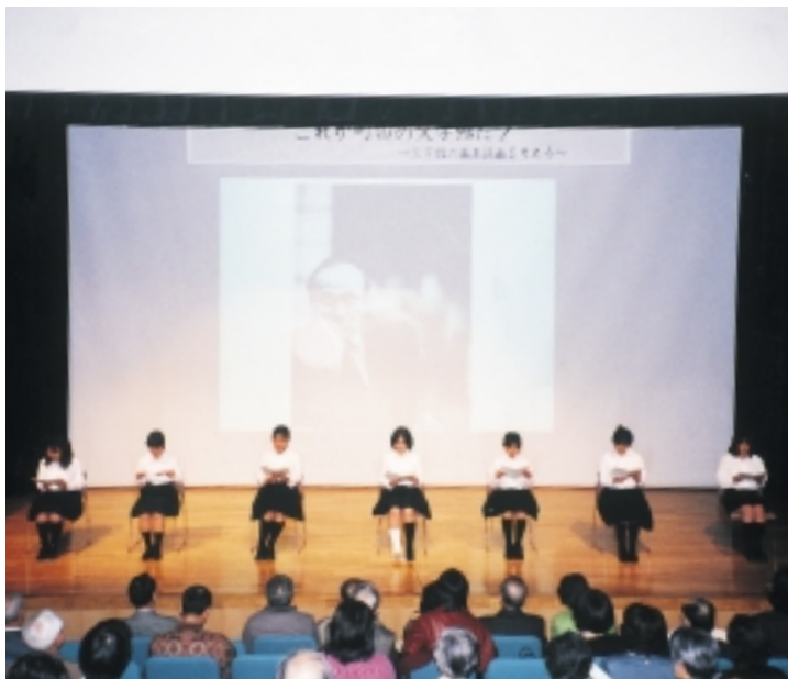
遠藤周作氏の作品を読む町田高校演劇部のみなさん

基本計画書は、「1. いま、なぜ文学館か」「2. 町田市の特質と文学館の基調」「3. 文学館の設置」「4. 目指すべき文学館像」「5. 文学館活動」「6. ホームページの作成と運用」「7. 管理・運営」「8. 活動を支える市民・専門家組織」「9. 建設計画」「10. 開館までのスケジュール」などの項目で構成されています。この基本計画書に基づいて、今年度は基本設計・実施設計を行う予定です。