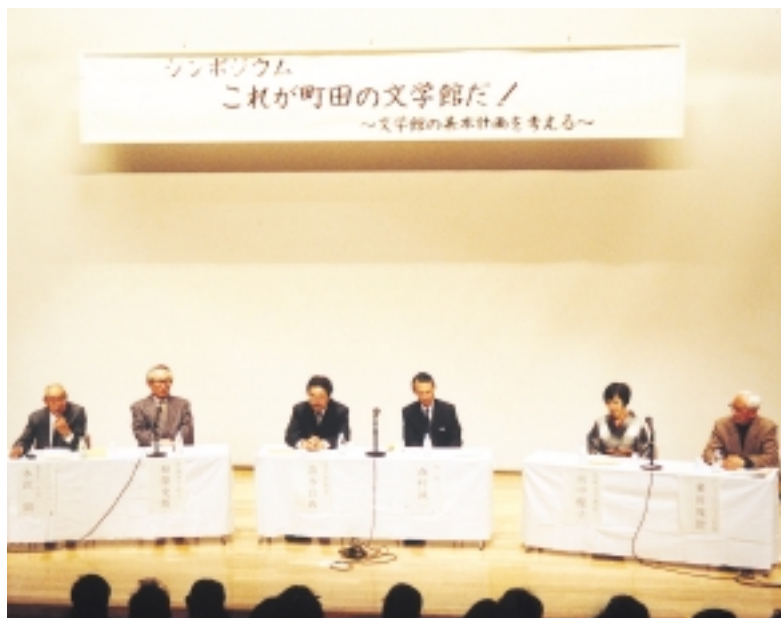
まちだ中央公民館にてシンポジウムが開催されました

2005年度に開館予定の(仮称)町田市立文学館の基本計画書「市民が集う文学館の創造」が、この程まとまりました。昨年10月に発足した町田市文学