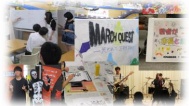
<図1>大作戦のイメージ