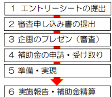
<図2>実施までの流れ