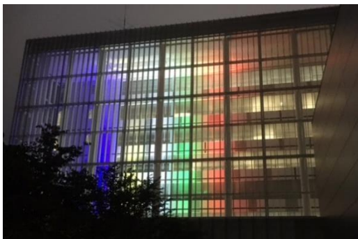
※東京 2020 オリンピック・パラリンピック 競技大会等の国際大会の気運醸成等促進