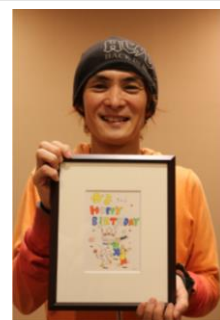
特製ポストカード