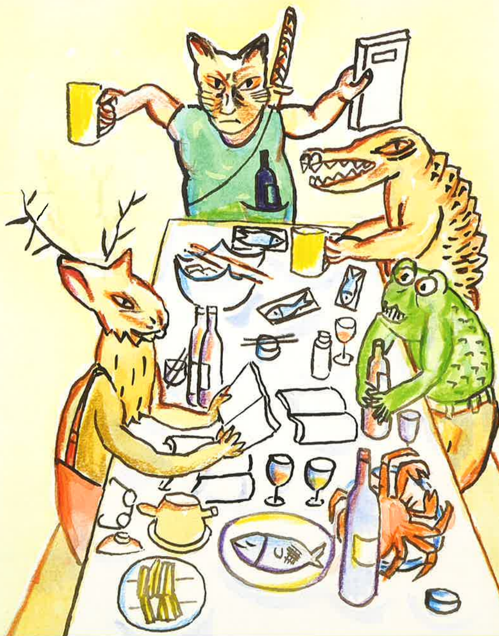
イラスト 沢野ひとし