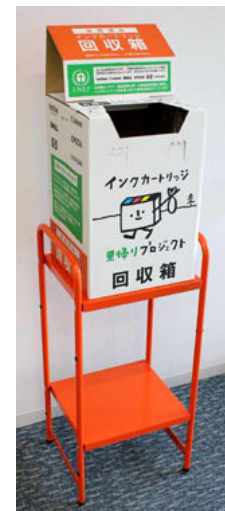
（インクカートリッジ回収箱）