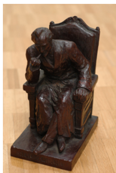
(第15回江戸川乱歩賞受賞記念トロフィー)