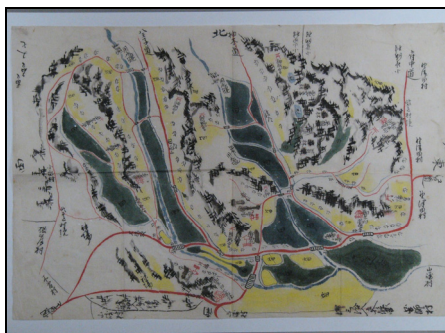
図師村絵図(江戸時代)

※ 「南多摩郡各町村縮図」については、上記で対象とした地域以外の村についても順次紹介する予定です。