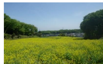
七国山周辺の菜の花畑