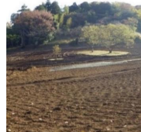
補助事業で再生された農地

債務負担行為 農業経営基盤強化資金利子助成金 (2002～2022年度債務負担行為事業 貸付残高の年利0.25%以内)