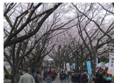
町田さくらまつり