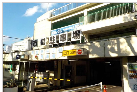
原町田一丁目駐車場