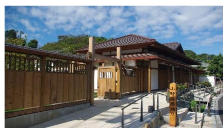
小野路宿里山交流館