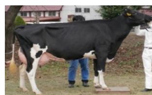
乳牛の品評会審査(畜産共進会)