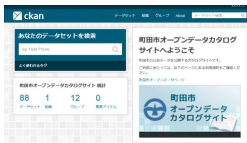
町田市オープンデータカタログサイト