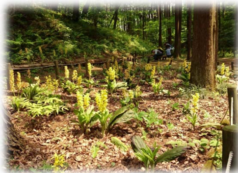
キエビネ(町田えびね苑)

主な特定財源 保全地域植生管理委託金(都) 1,500千円 町田えびね苑入苑料 1,316千円