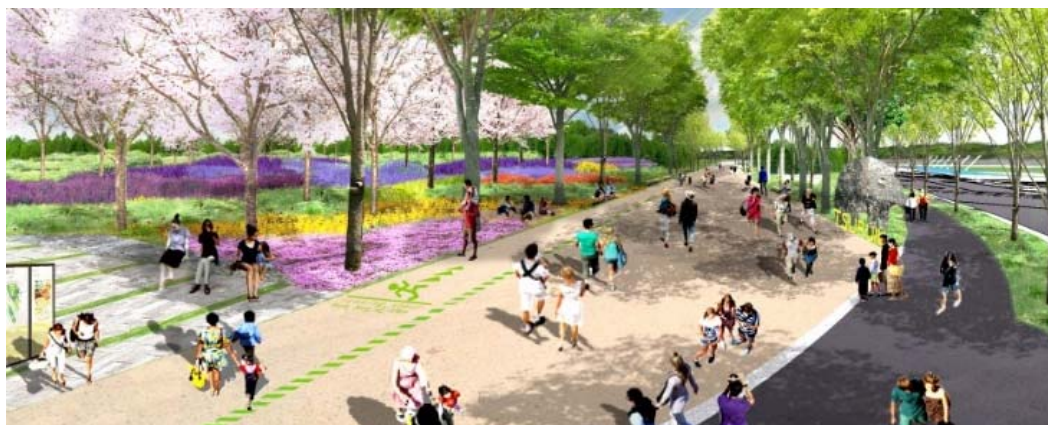
南町田拠点創出まちづくりプロジェクト 新たな公園整備イメージ

旧耐震基準(1981年以前)で建てられた木造住宅、分譲マンション、緊急輸送道路沿道建築物の耐震化を促進するため、耐震化費用の一部を助成します。2018年度は、鶴川6丁目団地(30棟)の改修工事や、藤の台住宅(52棟)の耐震診断への助成などを実施します。