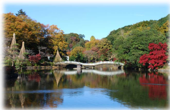
薬師池公園(たいこ橋)