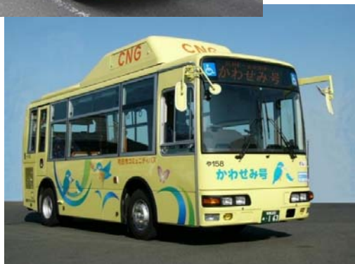
地域コミュニティバス 上:「玉ちゃんバス」 下:「かわせみ号」