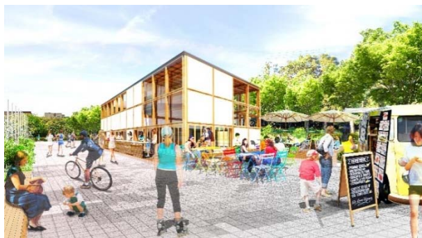
鶴間公園 カフェ・クラブハウス棟 イメージ