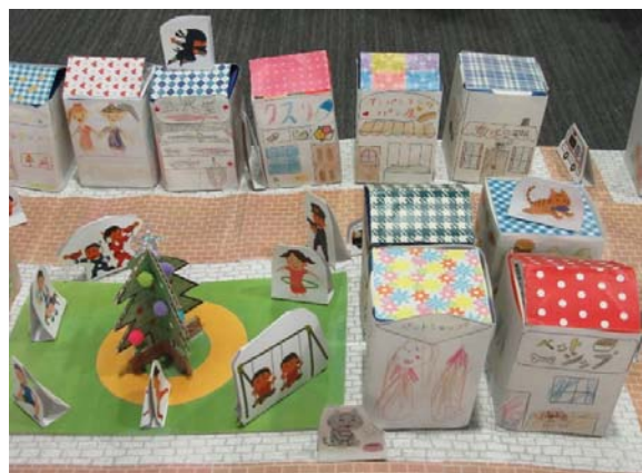
「まちカフェ」にて、景観の普及啓発活動を実施しました。