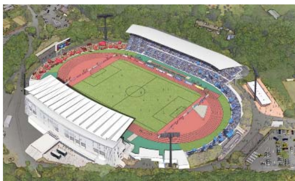
観客席増設整備イメージ