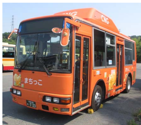
市民バス「まちっこ」