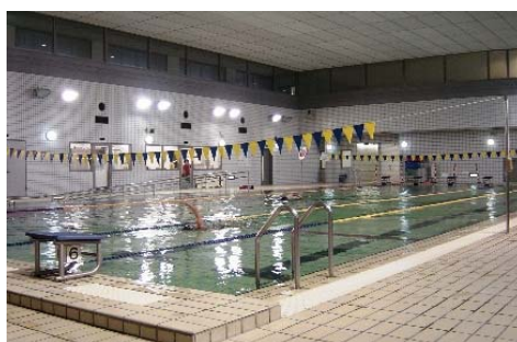
南中学校温水プール