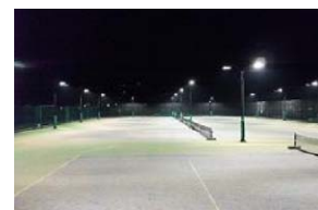
成瀬クリーンセンターテニスコート