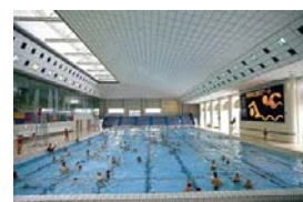
町田市立室内プール