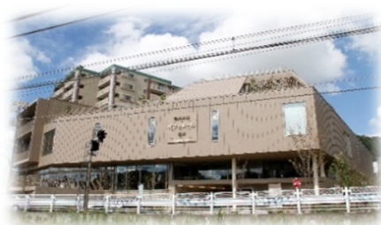
鶴川緑の交流館(和光大学ポプリホール鶴川)