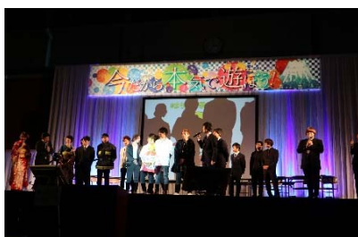
2017年度成人式の様子