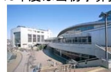
町田市立総合体育館