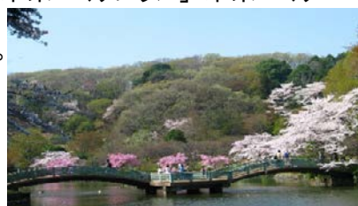
町田薬師池公園 四季彩の杜