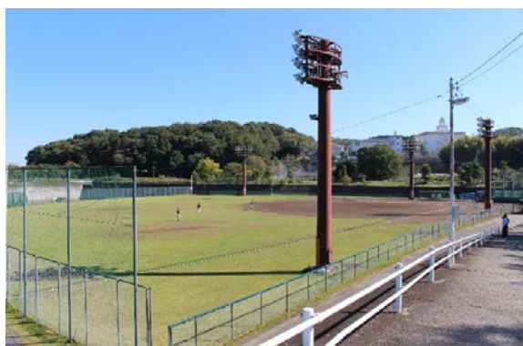
イメージ写真(三輪みどり山球場)