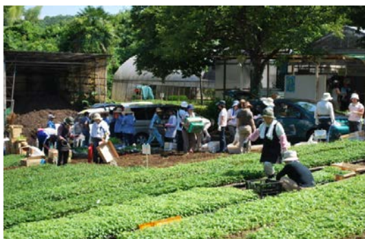
2014年度秋の花壇コンクール 苗の配布風景 市営下小山田苗圃にて、約360団体へ 花壇コンクール用苗を年2回配布して います。