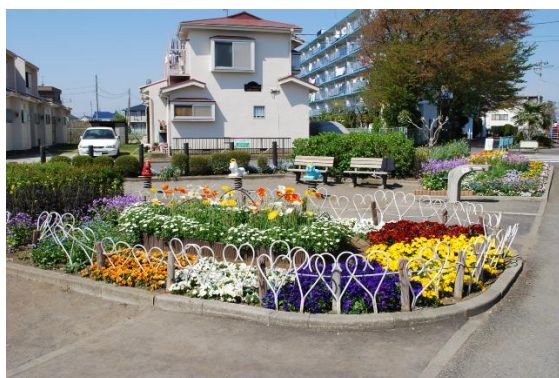
2014年度春の花壇コンクール 最優秀賞：鶴間三角公園清掃の会 春及び秋の花壇コンクールで約360 団体の中から、それぞれ50団体が受 賞しています。

主な事業費 花と緑のまちづくり普及支援業務委託料 23,782千円 花壇管理委託料 3,651千円