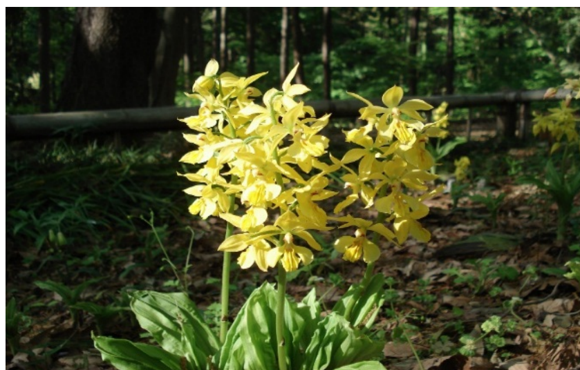
キエビネ (町田えびね苑)