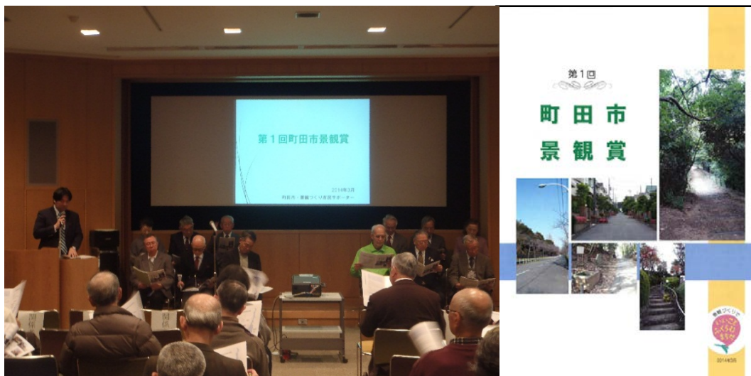
市民サポーターと協働で まちだ景観セミナーを 実施しました

※ 「景観づくり市民サポーター制度」とは、市の募集に応じて参加された市民の方が主体的な取り組みを行い、景観に関する普及啓発を行う仕組みです