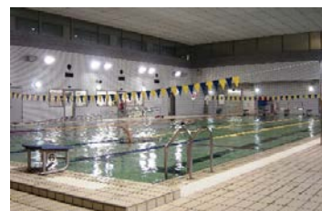
南中学校温水プール