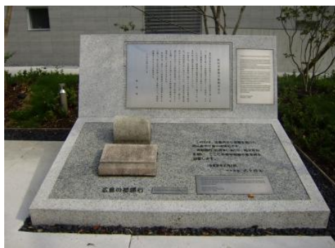
町田市非核平和都市宣言碑