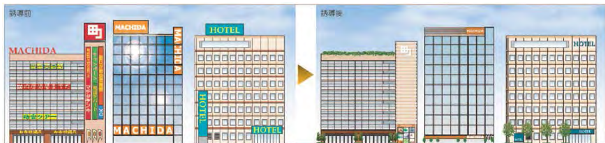
屋外広告物の誘導イメージ

※ 「景観づくり市民サポーター制度」とは、市の募集に応じて参加された市民の方が主体的な取り組みを行い、景観に関する普及啓発を行う仕組みです