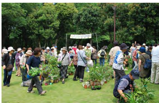
花と緑の交換会実施風景 ご家庭で不要となった鉢植えの植物を持ち寄り交換しあいます。 2012年度から忠生公園のボランティア事業として開催しています。