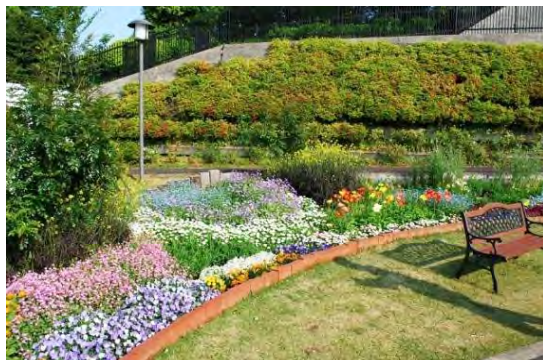
2013年度春の花壇コンクール 最優秀賞:悠々園

主な事業費 花と緑のまちづくり普及支援業務委託料 23,782千円 花壇管理委託料 3,845千円