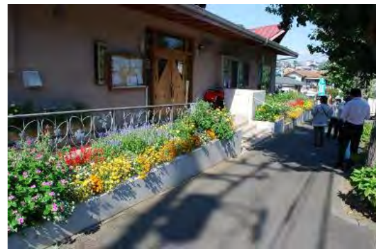
2013年度秋の花壇コンクール 最優秀賞:ききょう保育園