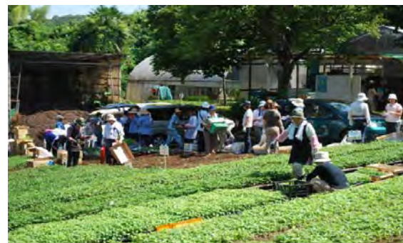
花壇コンクール苗の配布風景 市営下小山田苗圃にて、約360団体へ花壇コンクール用苗を年2回配布しています。