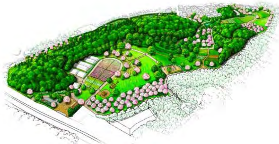
薬師池西公園イメージ