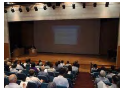
市民サポーターと協働で実施した「まちだ景観まちづくりフォーラム」

※ 「景観づくり市民サポーター制度」とは、市の募集に応じて参加された市民の方が主体的な取り組みを行い、景観に関する普及啓発を行う仕組みです