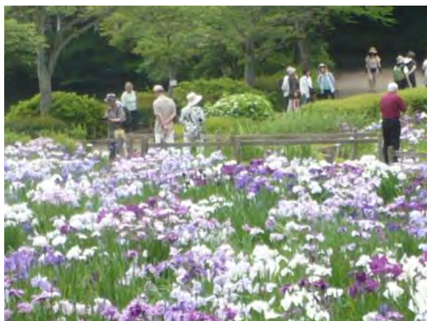
薬師池公園 花菖蒲