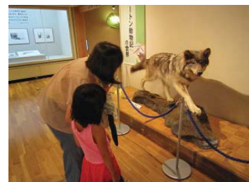
(2012年度の展示会の様子)