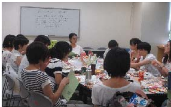
「乳幼児を持つ保護者のための講座」