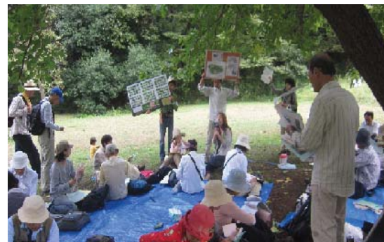
市民大学HATS「多摩丘陵の自然入門」