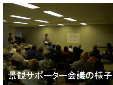
景観サポーター会議の様子