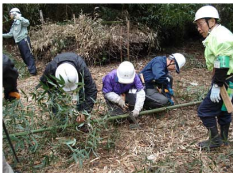
雑木林管理講習会(入門編) 広報やホームページで参加者を募集し、平日と休日各1回2日間のスケジュールで森の管理に必要な知識と技術を習得するための講習を行っています。