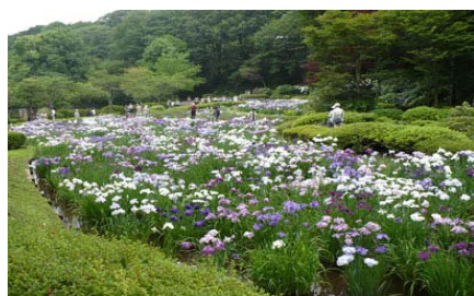
花菖蒲5月下旬から6月下旬に160種2,300株の花が咲きほこります。