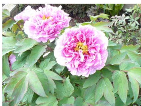
ぼたんの開花時期である4月中旬から5月初旬は、有料開園してます。その他の期間は無料開放されてます。ボタン以外にも芍薬、椿、山茶花、水仙、姫沙羅、萩等も植栽されてます。