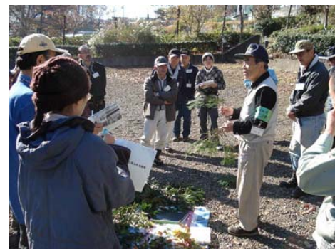
雑木林管理講習会(初級編) 入門編の受講者を対象に、ステップアップのための講習を全4日間のスケジュールで行っています。