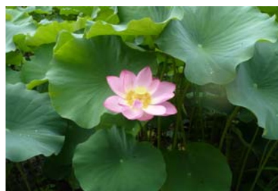
7月下旬から8月中旬にかけて淡いピンクの大輪を咲かせます。