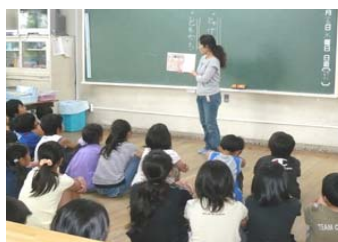
読み聞かせ授業風景

主な事業費 学校支援ボランティア謝礼 22,940千円 設備保守点検委託料(施設) 46,524千円